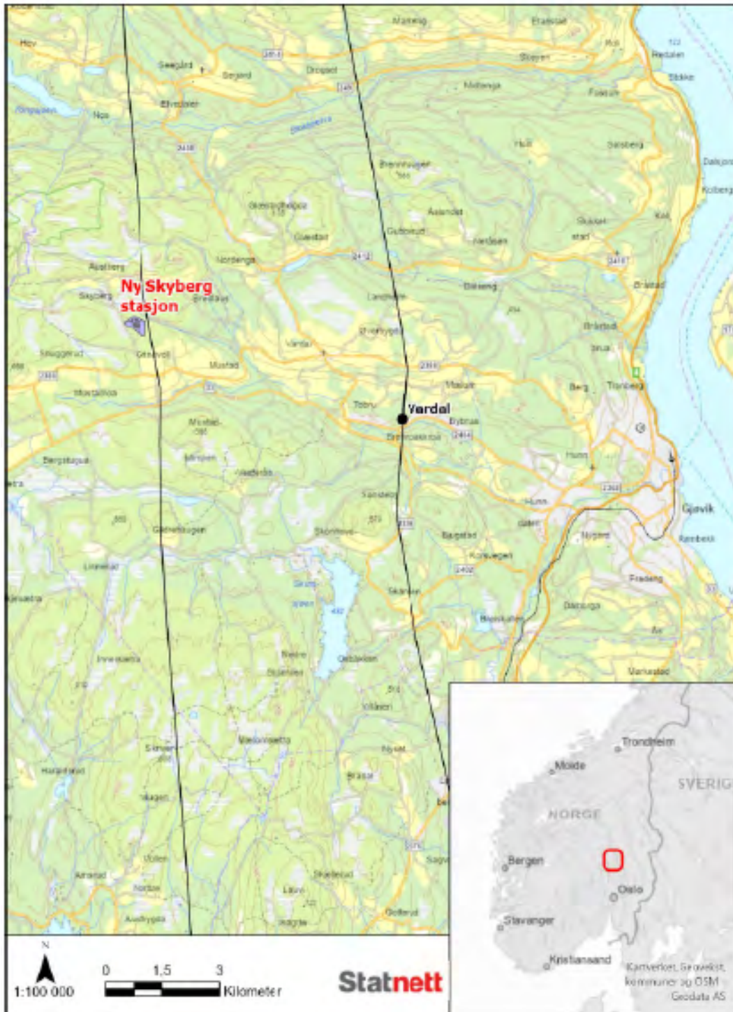
Figur 2. Plassering av omsøkt Skyberg og eksisterende Vardal transformatorstasjoner.