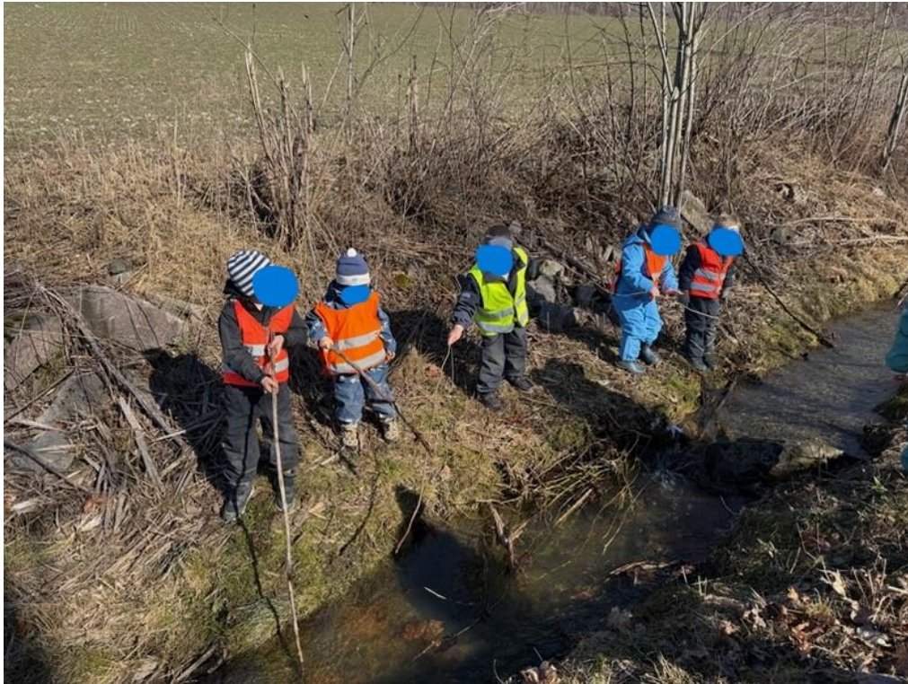
Fisketur i bekken