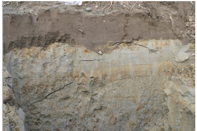
Jordtypene dokumenteres ved hjelp av profilbeskrivelser.