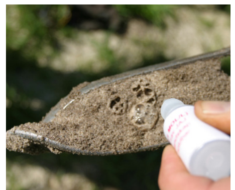
Ved hjelp av saltsyre testes jorda for skjellfragmenter.