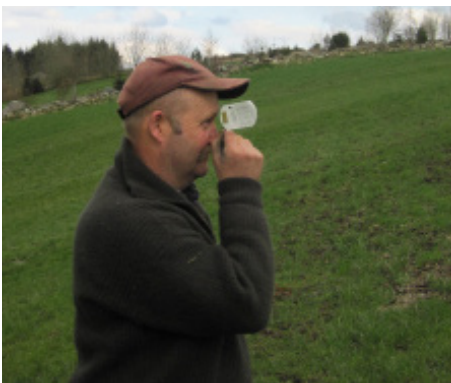
Stigningsmåler brukes til å måle dominerende hellingsgrad innenfor en jordfigur.