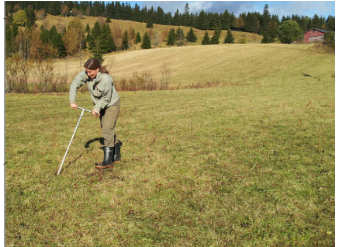
Ulike jordtyper ved identifiseres ved hjelp av jordbor, med undersøkelse av jorda ned til en meter.

Jordkvalitet Dreneringsforhold Dyrkingsklassekart Erosjonsrisiko WRB-grupper (jordgrupper) Kartene finner du på : www.skogoglandskap.no/kart/kilden