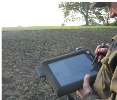
I felt foregår registreringen av jordtyper på en felt-PC med digitale flybilder.