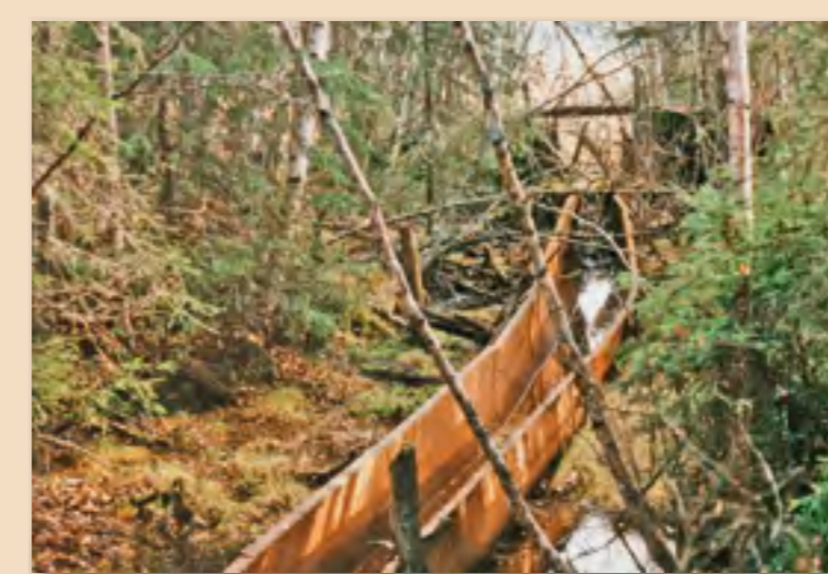
Den øverste delen av tømmerrenna var av jern (kan fortsatt sees nedenfor post 2).