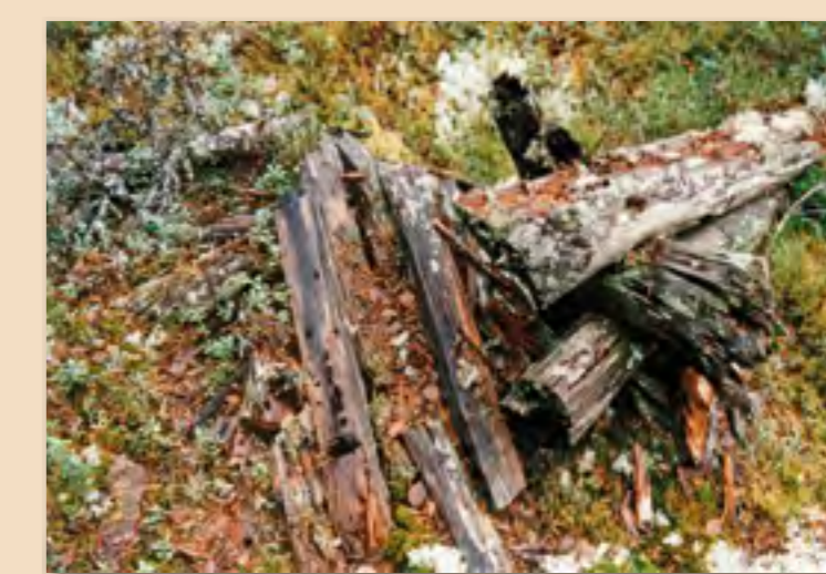
De siste rester av tømmerrenna.

Bebyggelse merket med oransje er bygninger som har vært tilknyttet virksomhetene ved Fallselva.