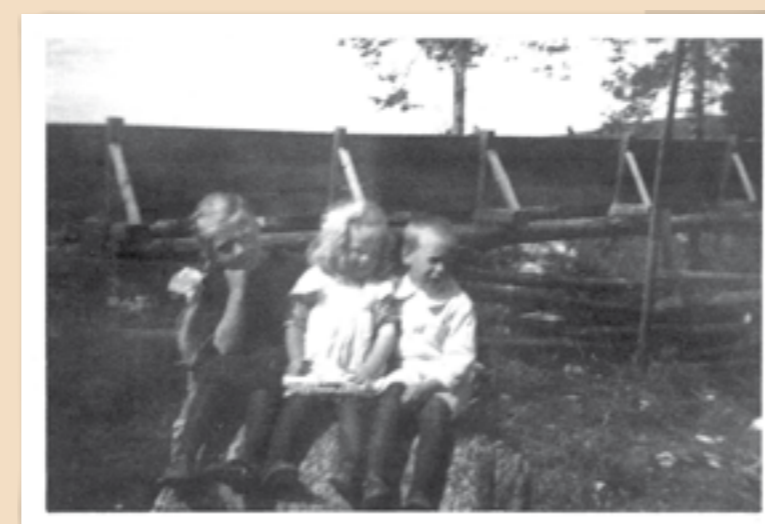
Tre små søsken fra Fjellhaug foran tømmerrenna rett øst for Skrankefoss.

Som man ser, så består disse to energibeskrivende ordene av de samme bokstavene.