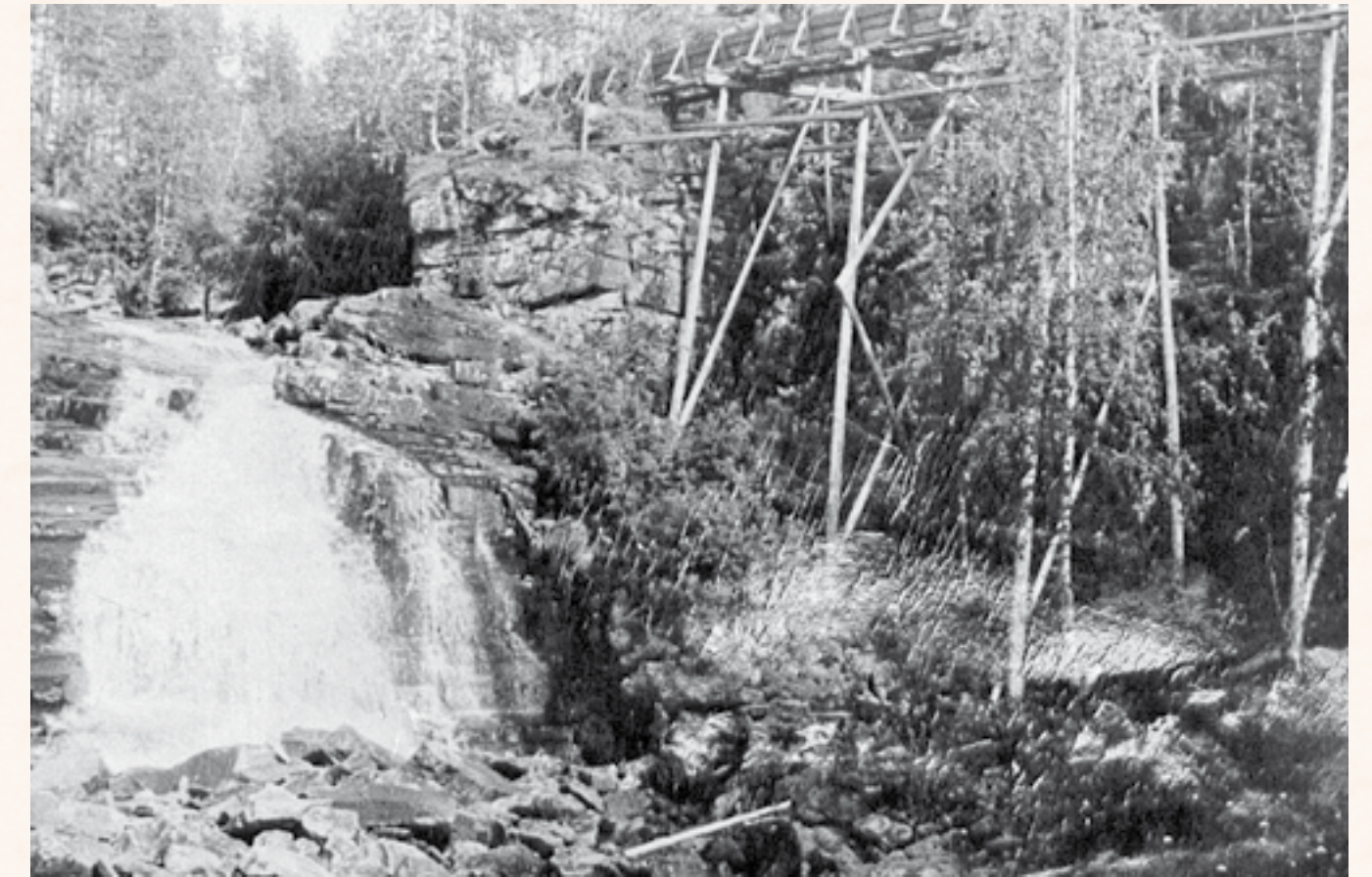
Høgskranken, det luftigste stedet på rennestrekningen mellom Trevatna og Randsfjorden. Du kan lese mer om renna på post 6.

Renna ble mye benyttet som gangvei. Også om vinteren, av og til med ski på beina. Det finnes mange historier om nervepirrende sekunder over Høgskranken. Historier om vannet som kom akkurat da. Forvarselet om at tømmerstokkene snart var motgående trafikanter. Om de to frierne, som i høstmørke og fossebrus, verken så eller hørte og dermed kolliderte rett over juvet. Om mannen med 100 kilos mjølsekk, fraktet hele veien fra Mølla, og som møtte vannet her. Om modig ungdom som passerte på ski på en snødybde som gikk over rennekanten.