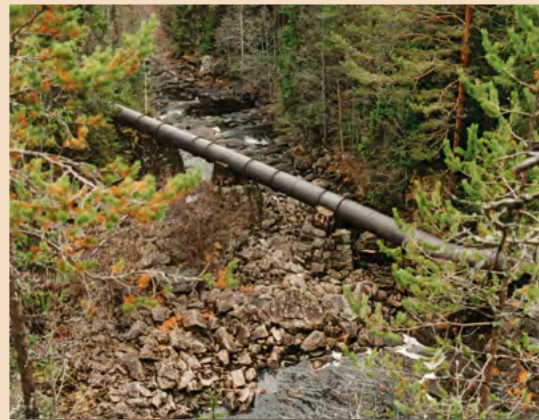
Her ser vi det gamle jernrør (1910- 2009) som krysser Høgskranken.