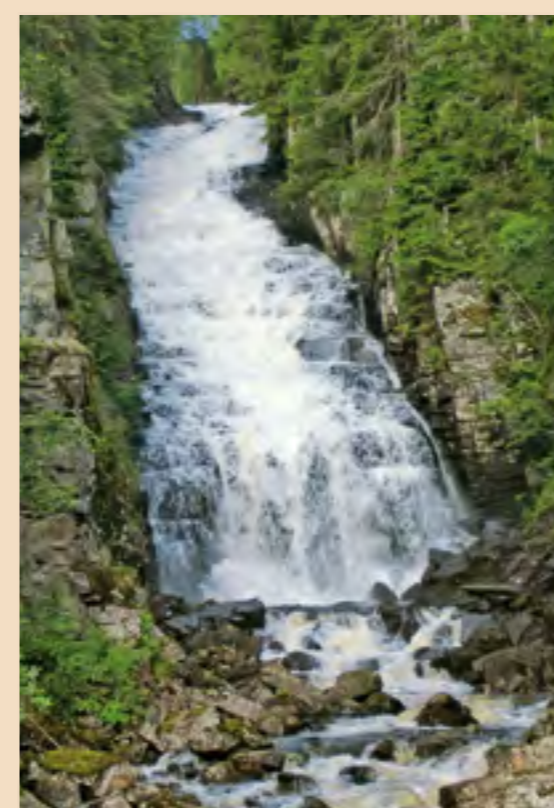
Den nye Felloppen er et imponerende og kraftfullt syn.