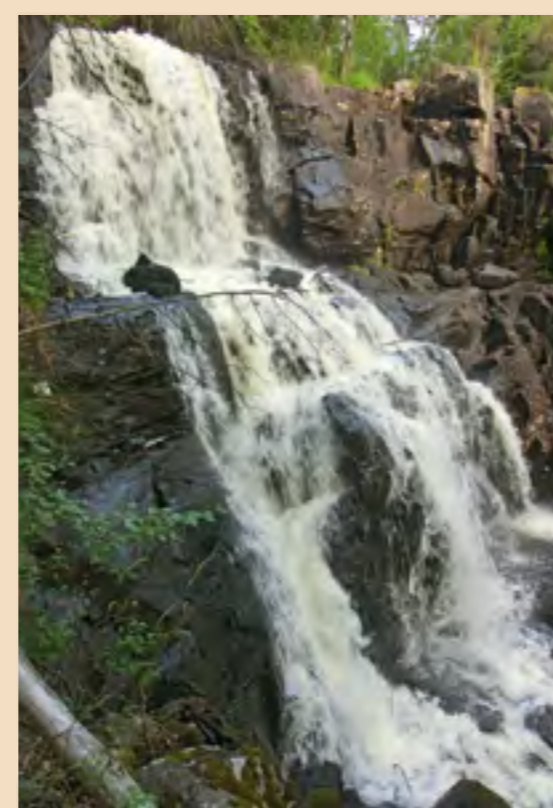
Et vakkert, men litt bortgjemt parti øverst i den gamle Felloppen.

I 1884 ble Fellesfløteforeningen stiftet, og sprengte i 1884-85 ut et nytt og rett elveløp mellom dam og fabrikk for å lette fløtingen og spare tømmeret. Bergefossen, lenger ned mot fjorden, er et annet resultat av dette. "Nye Felloppen" er den iøynefallende "trappetrinnsfossen" man i dag kan beskue fra sørsiden av fabrikk. Det er den de fleste tenker på som Felloppen. Etter den utvidete reguleringen av elva fra 2009 er vannføringen redusert. "Bakvatnet" som før kom ut i elva fra kraftstasjonen på Skrankefoss, ender nå i Randsfjorden ved den nye kraftstasjonen der. Felloppens store fossebrus og kraft kan allikevel oppleves i flomtider. Den gamle fossen ga ideen og industristarten - den nye fraktet tømmeret - og fallet ga kraften.