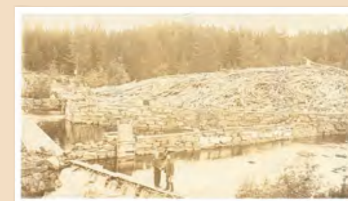
Bilde av Veadammen på begynnelsen av 1900-tallet.